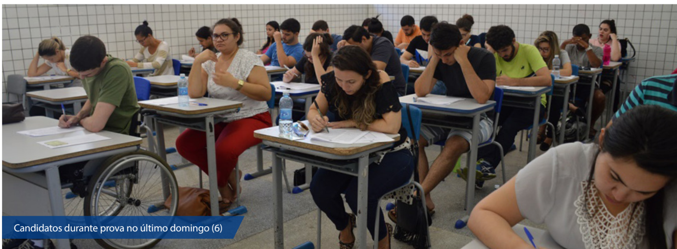
Candidatos durante prova no último domingo (6)

A Defensoria Pública do Estado do Rio Grande do Norte (DPE/RN) aplicou, neste final de semana, as provas do VII Teste Seletivo para estagiários de Direito. Os exames foram realizados em Natal e no interior do Estado, das 9h às 13h. O gabarito oficial será divulgado até a próxima sexta-feira (11), no site e em redes sociais.