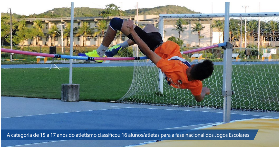
A categoria de 15 a 17 anos do atletismo classificou 16 alunos/atletas para a fase nacional dos Jogos Escolares

Com quatro medalhas de ouro conquistadas, a Escola Municipal Dep. Maria do Céu Pereira Fernandes, de Goianinha, sagrou-se campeã no atletismo de 15 a 17 anos dos Jogos da Juventude Escolar do Rio Grande do Norte (VI JUVERNs). O segundo lugar ficou com a Escola Estadual Querubina da Silveira, do município de Cerro Corá, que somou três medalhas de ouro e duas de prata.