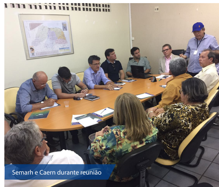
Semarh e Caern durante reunião

Também participaram da reunião representantes da Federação dos Trabalhadores na Agricultura (Fetarn), Federação dos Trabalhadores na Agricultura Familiar (Fetraf), Serviço de Apoio aos Projetos Alternativos comunitários (Seapac) e vereadores.