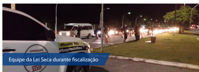
Equipe da Lei Seca durante fiscalização

Amadrugada do domingo (06), em Natal, contou com a realização de duas blitzes simultâneas de fiscalização da Operação Lei Seca do Departamento Estadual de Trânsito do RN (Detran). As barreiras foram montadas no cruzamento das Avenidas São José com Raimundo Chaves, em Candelária, e na Avenida Engenheiro Roberto Freire, em Capim Macio. No total, 67 condutores foram autuados por desrespeito a Lei Seca, sendo dois deles presos sob acusação de crime de trânsito.